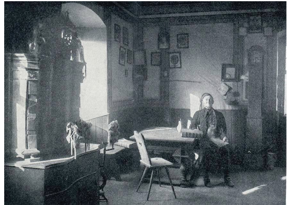
Um 1840, fränkische Bauernstube