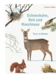
Müller, T. (2017). Schneehuhn, Reh und Haselmaus . Hildesheim: Gerstenberg.