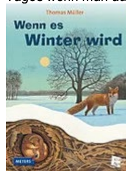
Müller, T (2008). Wenn es Winter wird . Mannheim, Leipzig, Wien. Zürich: Meyers Lexikonverlag