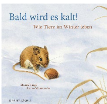
Lange, M., & Walentowitz, S. (2002). Bald wird es kalt! Wie Tiere im Winter leben . Aarau: Sauerländer.