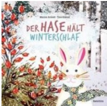
Anold, M., & Küenzi, T. (2018). Der Hase hält Winterschlaf . Glarus: Baeschlin