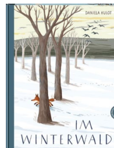
Kulot, D. (2021). Im Winterwald . Neuauflage 2022. Stuttgart: Thienemann.