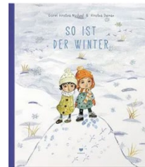
Näslund, G. K. (2015). So ist der Winter. Eines Tages wenn man aufwacht ... Zürich: Bohem.